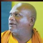
釈ボディダルマ禪士