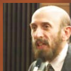
カール・ベッカー