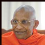
スマナサーラ長老